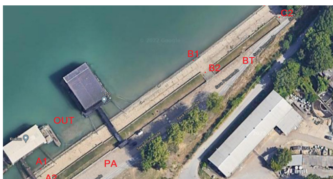
Slika 1. Područje istraživanja: A) uzvodno od ispusta (OUT); B) i C) nizvodno od ispusta; PA) šetalište; BT) biciklistička staza

Istraživanje je rađeno u maju 2022. godine na Savi. Područje istraživanja je prikazano na Slici 1. Ono obuhvata potez između novog i starog železničkog mosta, od 3. do 2.7 rkm, gde se nalazi jedan od većih ispusta otpadnih voda na teritoriji grada Beograda (prosečni protok od 94.250 m 3 otpadnih voda/danu). Područje je zanimljivo i po tome što pristup samom ispustu (OUT - na slici) nije ni na koji način ograničen, iako se nalazi u neposrednoj blizini rekreativne zone (biciklistička (BT) i pešačka staza (PA)). Na splavovima na mestu samog ispusta se nalaze ugostiteljski objekti, a područje je veoma zanimljivo i za sportske ribolovce. Na odabranom potezu, ispitivana su su tri mikro-lokaliteta: (A) uzvodno od ispusta (OUT) i (B, C) nizvodno od ispusta.